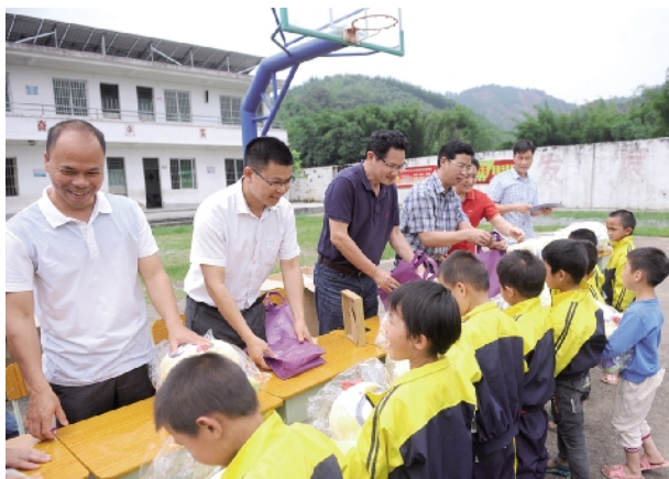
■广州血液中心和当地领导向小学生们赠送“六一”儿童节礼物