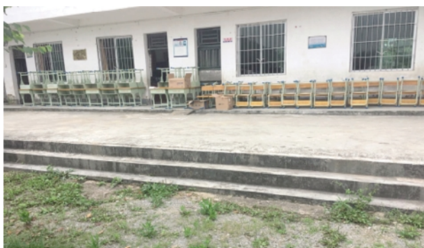
■广州血液中心捐赠的课桌椅和图书

为了让对口帮扶村的小学生们过一个欢乐祥和的“六一”儿童节,5月26日,广州血液中心代表广州市卫生计生委深入对口帮扶村——英德市九龙镇太平村开展“六一”儿童节慰问活动。