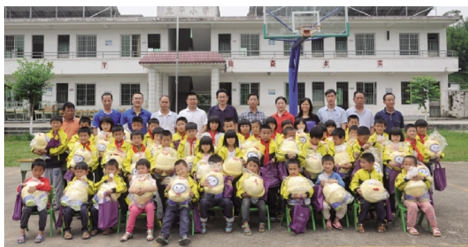
■广州血液中心领导、当地领导和老师、学生们合影